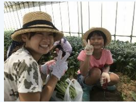
ひと家族1袋に小松菜詰め放題☆