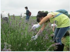
ひと家族30本のラベンダーを収穫