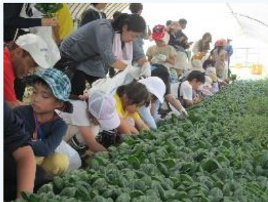
北本農園で小松菜の収穫をしました♪