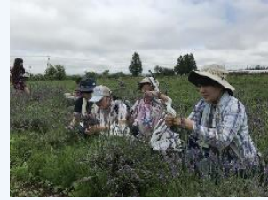
ハーブティの試飲やバンドルズのキットをプレゼント☆