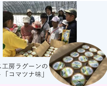
牧場アイス工房ラグーンのジェラート「コマツナ味」